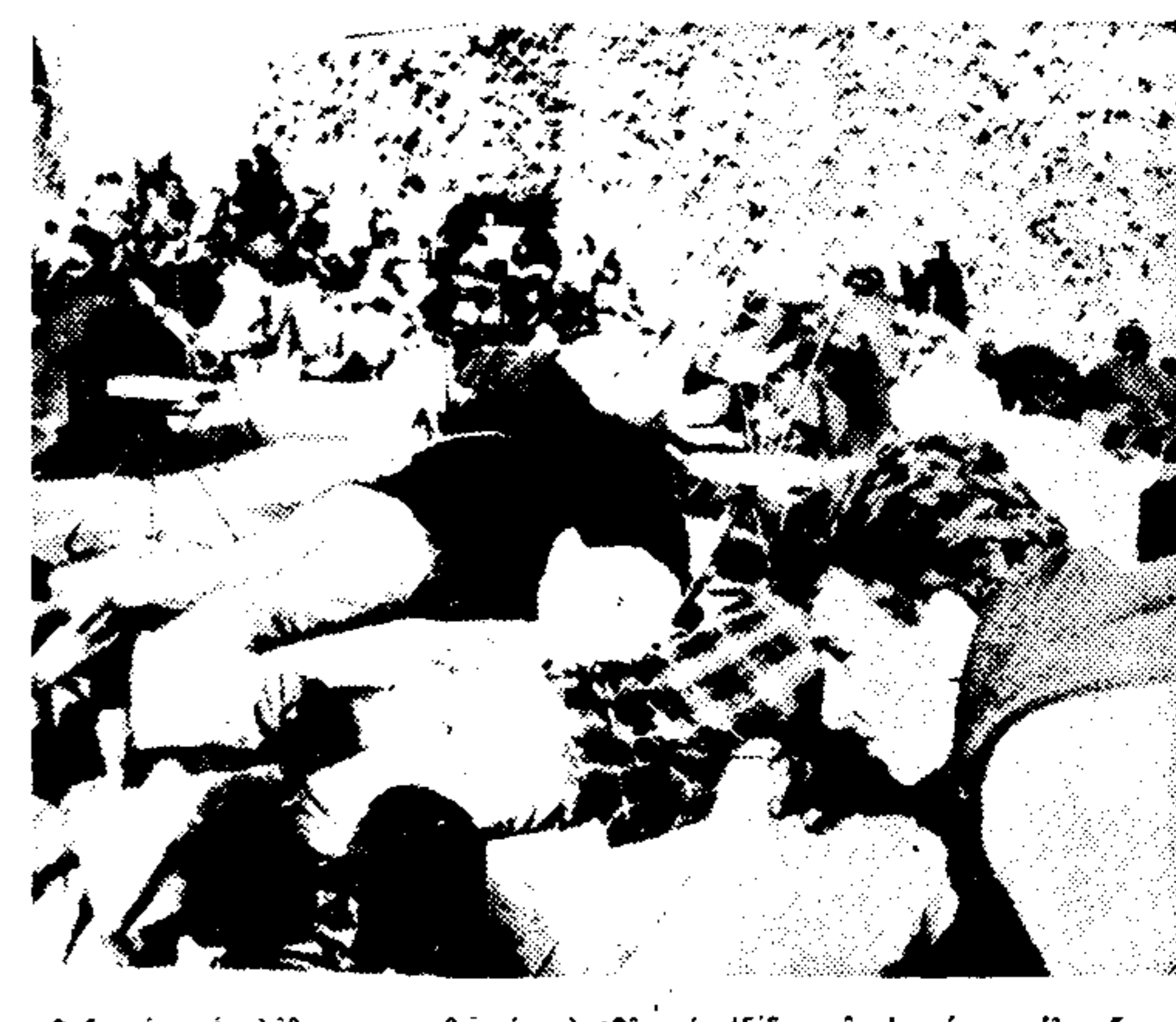
Φωτισμένο το πλήθος προσώπων να καλωσόριζαν στην Ελλάδα τον επίσημο μιλία...

ΜΠΟΥΕΝΟΣ Α-Ι-ΡΕΣ, 21. Αρσσοειδίτην Πρέσ, Ρούτερ, Γαλλικό Πρακτεριο, Γιουαίντεν Πρέσ.