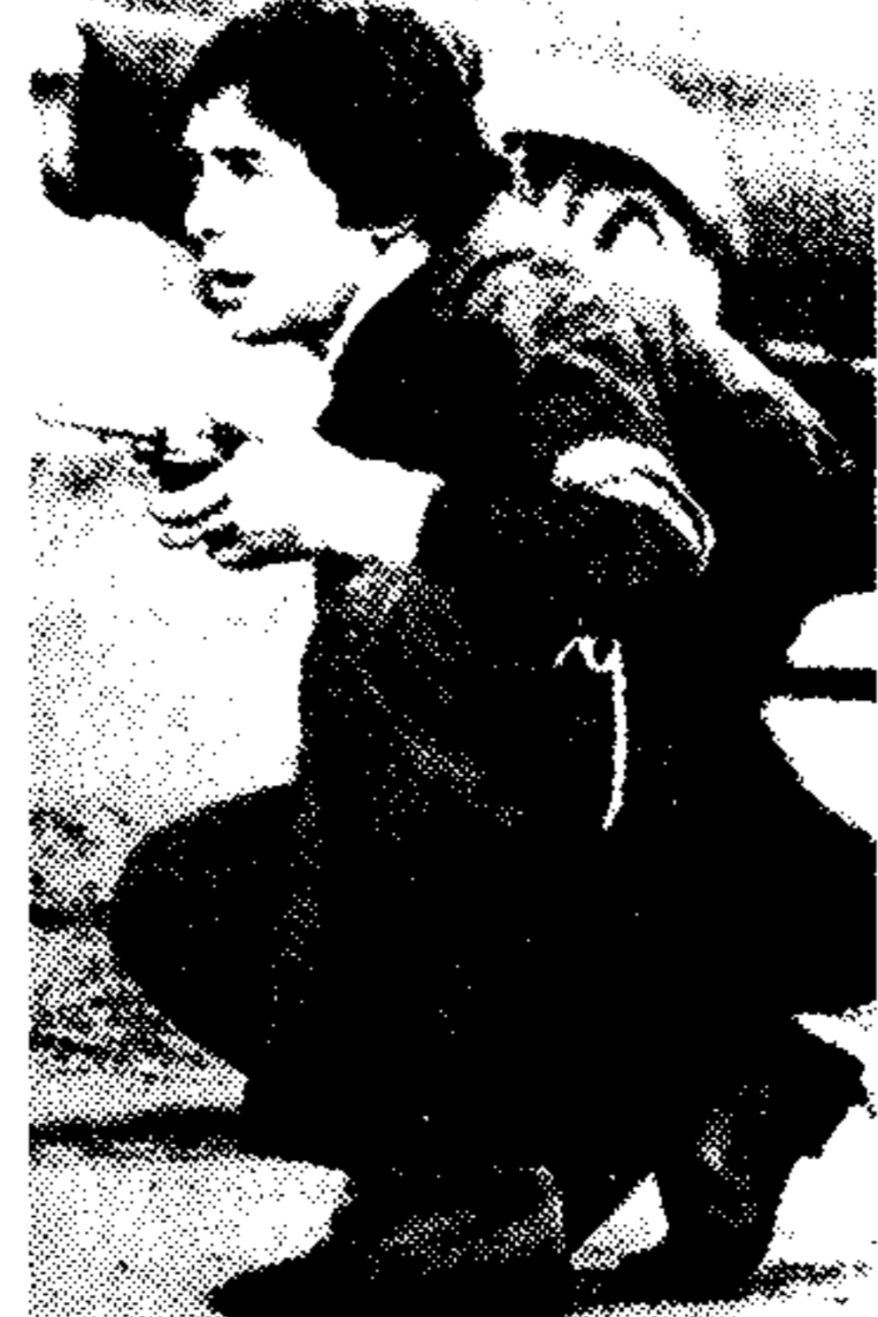
Με το περίστροφο στο χέρι. Ένα μέλος της Νεολογίας των Περών...