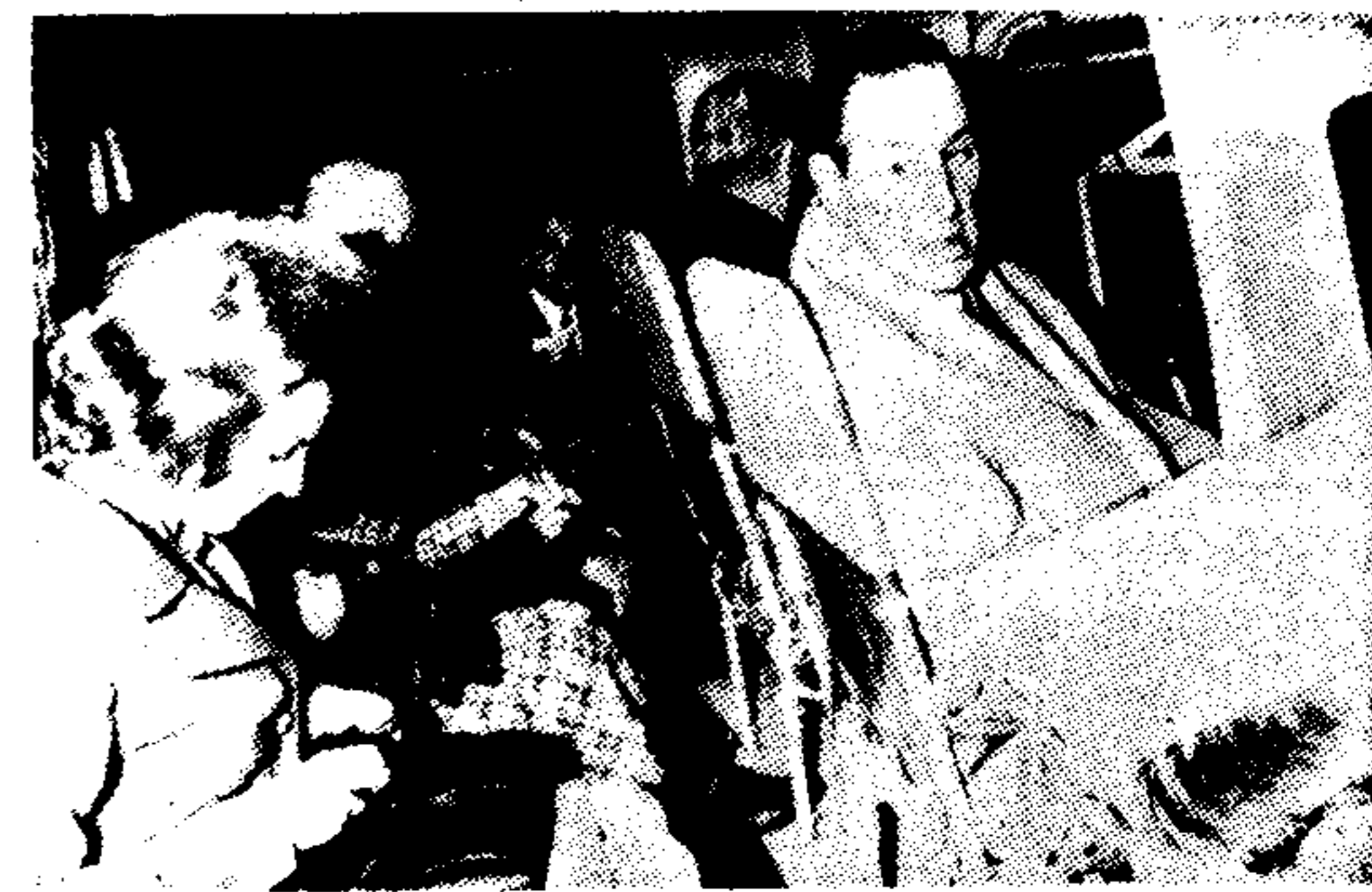
Απόφαση του Χουάν Περών κατά της επίσημης μιλίας του Μορόν...